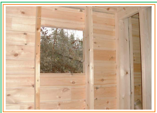
1. Man gör ett fönsterhål i stommet.