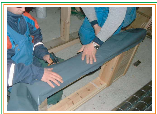
4. Spänner åt ISOLINA-linisolering med plastremsa. Nitar fast plastremsan på fönsterkarmens sidor.