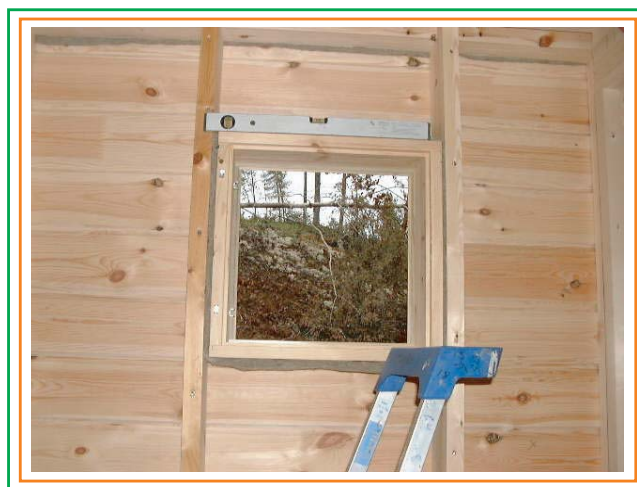
10. Vid smala fönsteröppningar är inte öppningens över- och underregel nödvändigt.