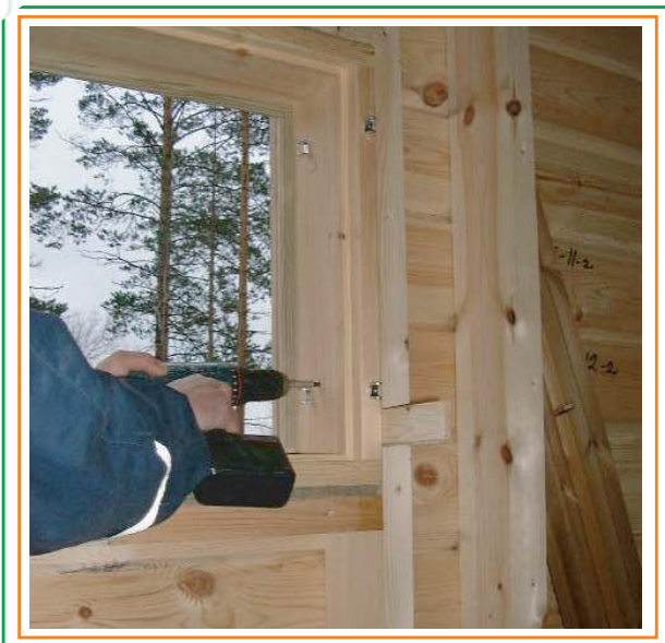
7. Fäster fast fönsterkarmen med skruvar.