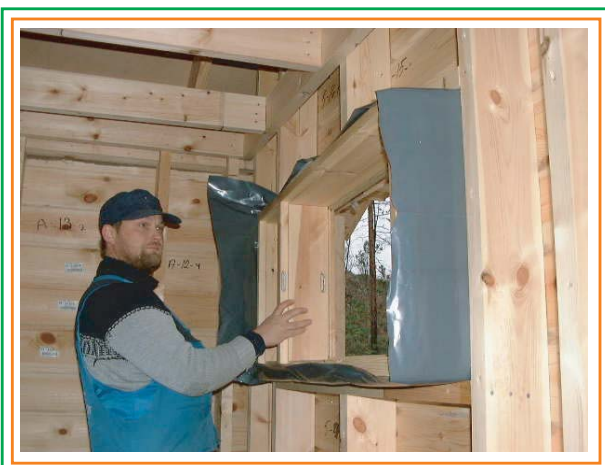
5. Installerar fönstret på plats.