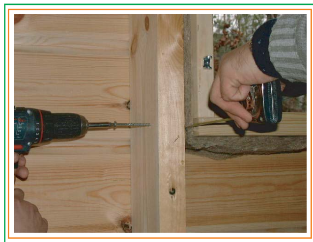
8. Små fönster och ventilationsluckor kan fästas med skruvar från stommets bakdel.