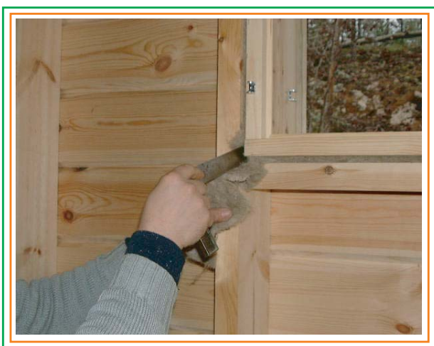
9. Kontrollerar tätningen på fönstrets hörn.