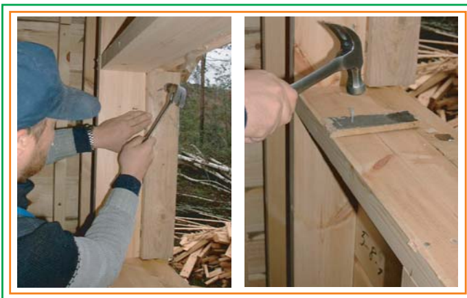
2. Installerar stoppare på fönstret och tättningsreserv på underregeln.