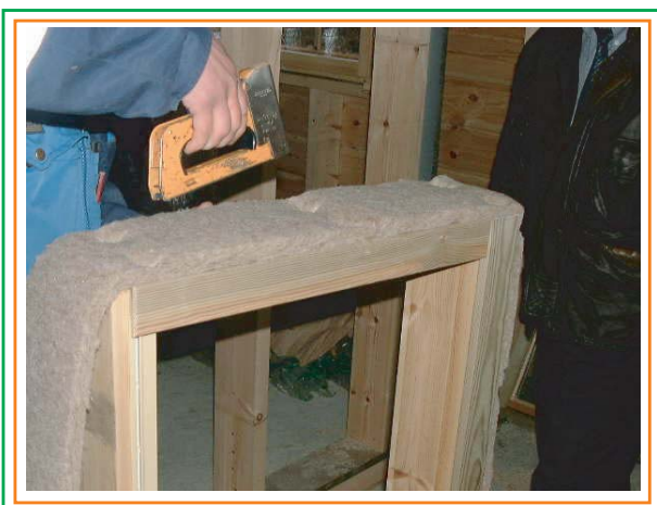
3. Fäster ISOLINA-linisolering på fönsterkarmen med nitpistol.